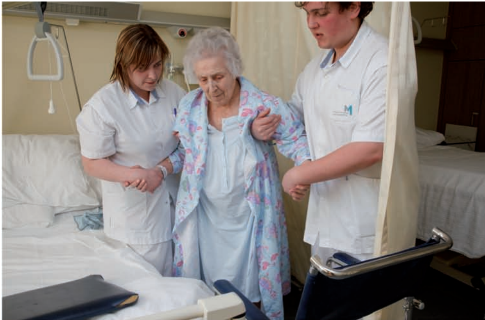
Az St. Maarten, Duffel