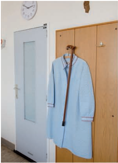
Az St. Maarten, Duffel