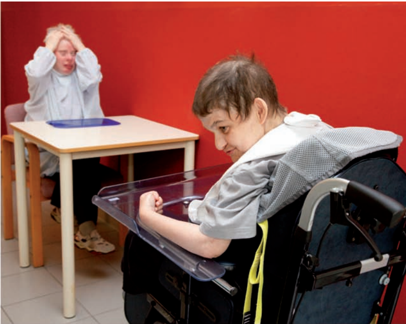
't Zwart Goor, Merksplas