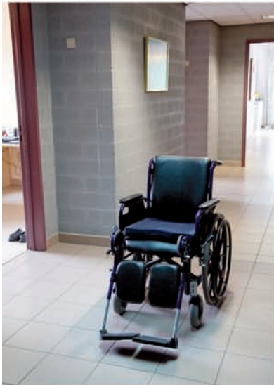
't Zwart Goor, Merksplas