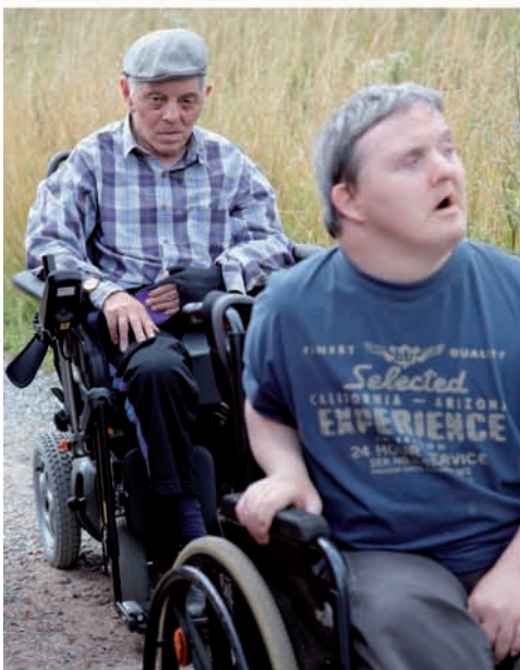
Ons Tehuis Brabant, Kampenhout, Jokakamp