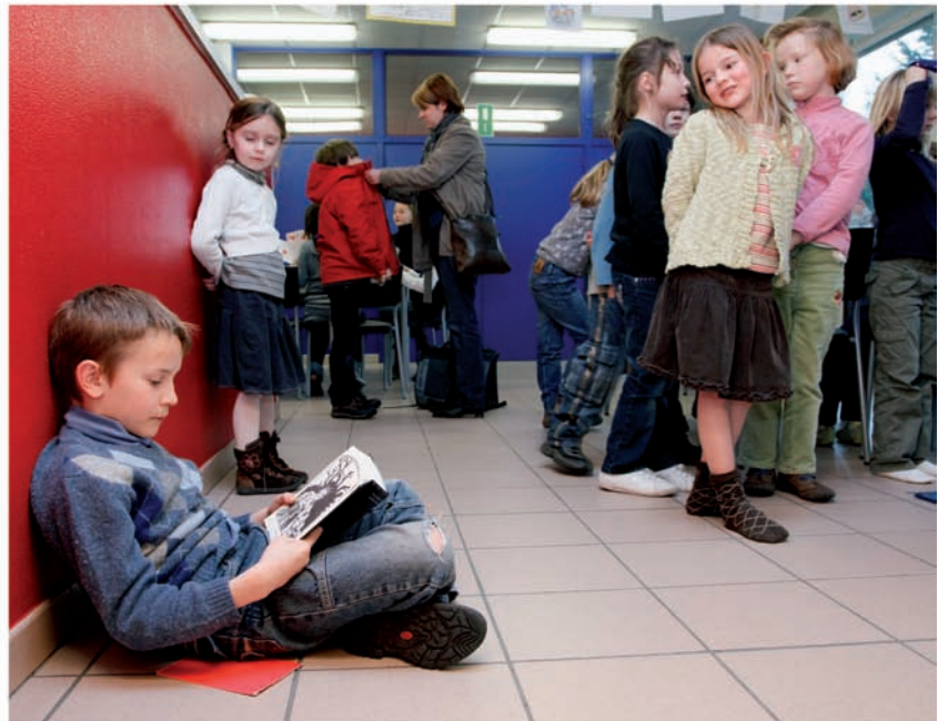
Initiatief buitenschoolse opvang, Duffel