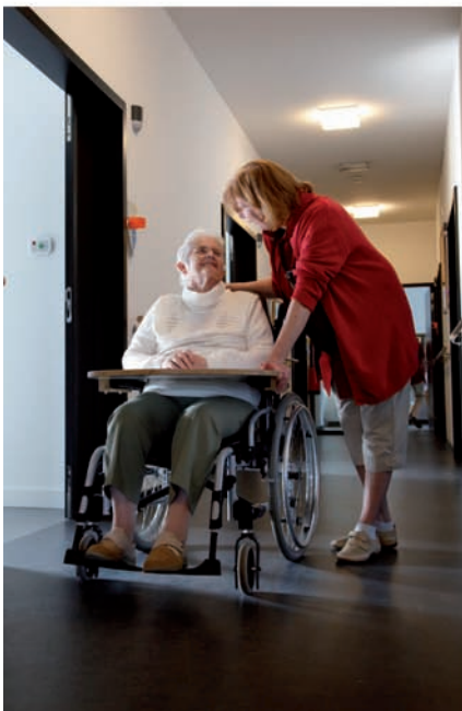
Ten Kerselare, Heist o/d Berg