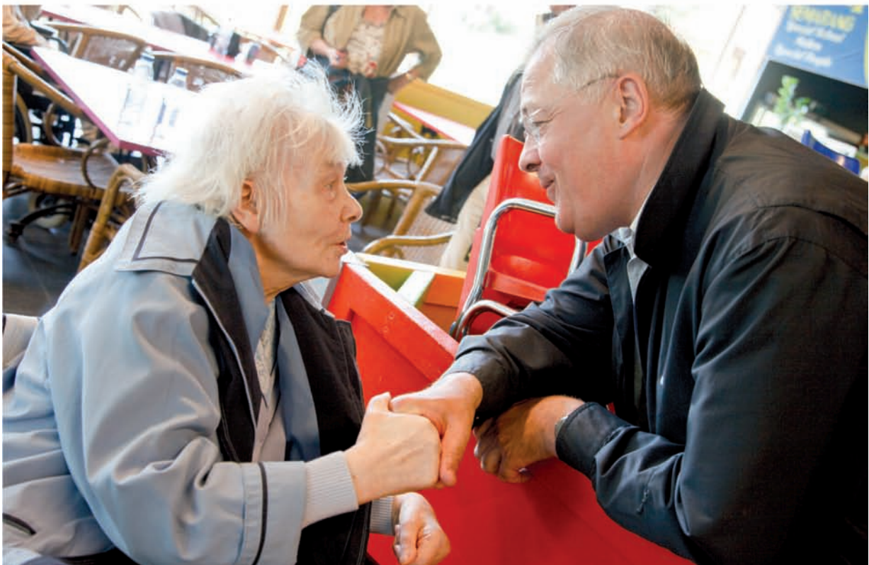
RVT Huize Monika. Present Caritas Vrijwilligerswerk