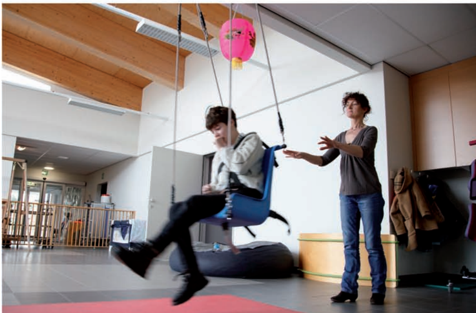
Dagcentrum De Maretak, Duffel