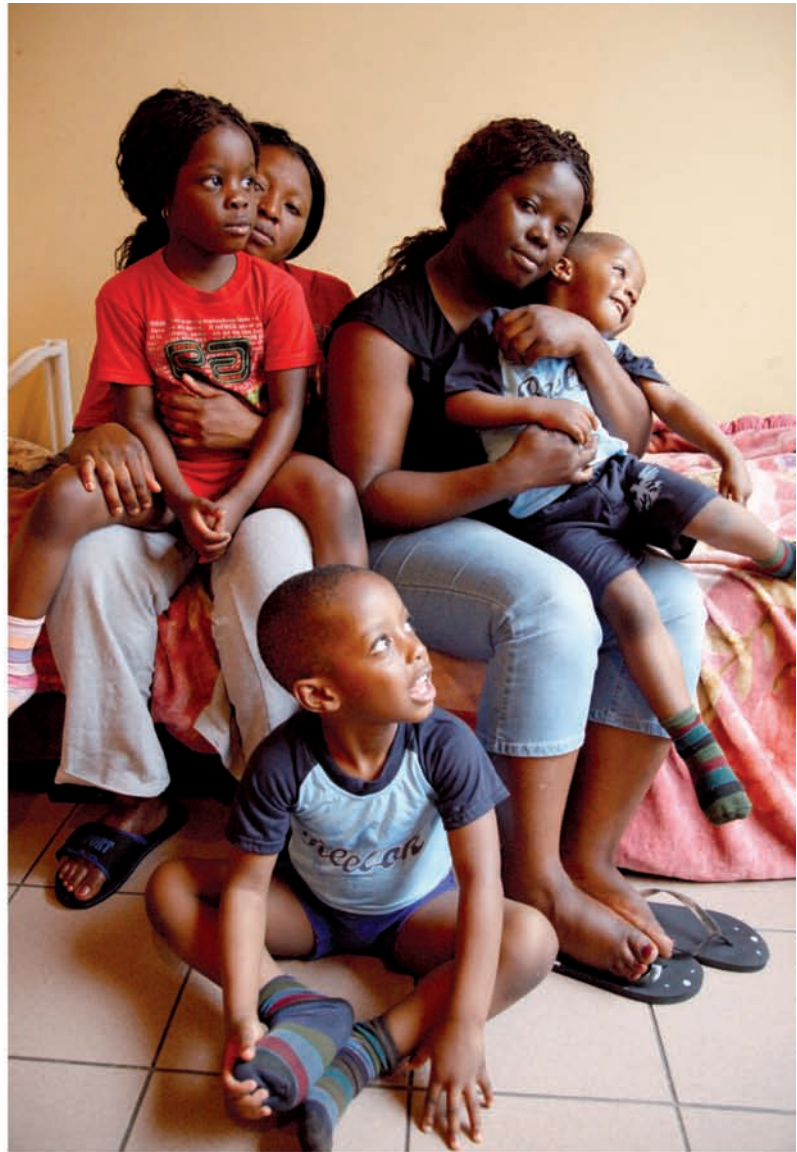
Caritas International. Opvang asielzoekers